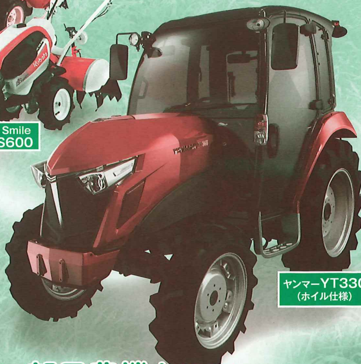
ヤンマーYT330 (ホイル仕様)